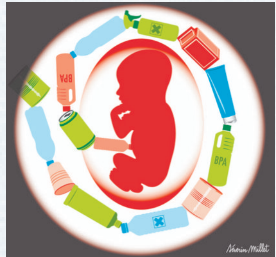
Dessin Séverin Millet*

Ces résultats 8 ont conforté la décision des pouvoirs publics français d'interdire l'utilisation du BPA pour tous les emballages alimentaires à compter de 2015.