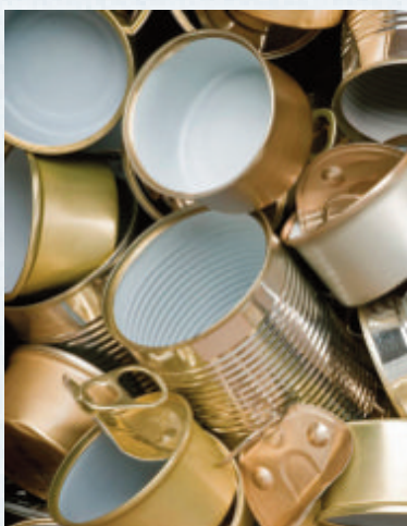
Vernis à l'intérieur des boîtes de conserves

Des pistes innovantes sont actuellement en cours de tests, notamment avec des polyphénols tanniques (Inra et ENSCM de Montpellier) ou Eden Foods (USA).